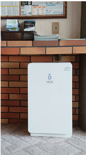
フロント・ロビー

安全で清潔な環境を作り、お客さまが快適なひとときをお過ごしいただけますよう準備をしてお待ちしております。